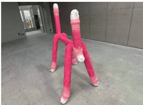
《paste7》 2025年 ミクストメディア H170×W60×D130cm