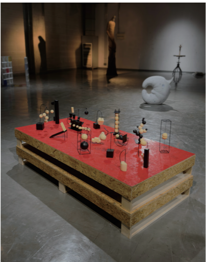
《Melting Gravity》 2026年 ミクストメディア H50×W182×D92cm