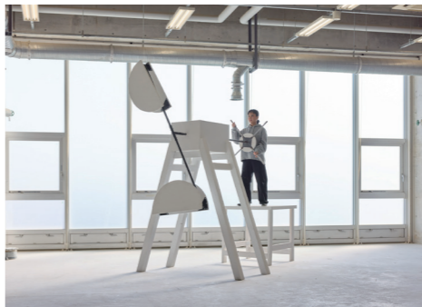
《move by us 3》 2025年 ミクストメディア H300×W211×D180cm