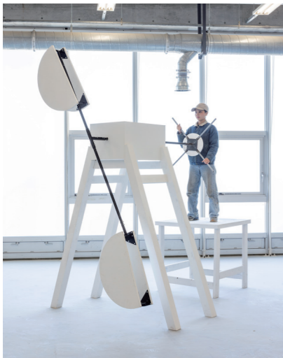
《move by us 3》 2025年 ミクストメディア H300×W211×D180cm