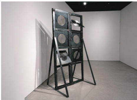
《Shutter Telegraph》 2024年 鉄 H180×W80×D70cm